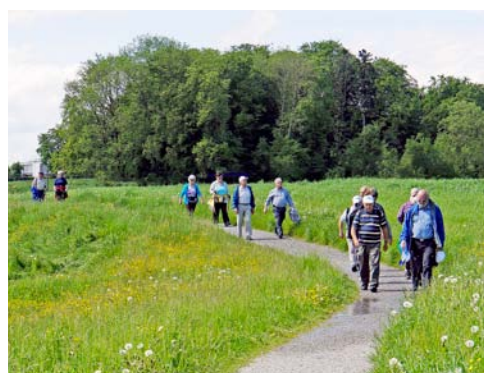
Das Feld ist schon ziemlich in die Länge gezogen.

So ähnlich wird es am 14. August auf dem Grillrost aussehen.